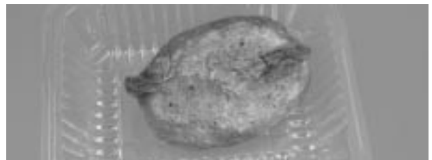
販売された「招福 与次郎そばいなり」

本会では、秋田市民が名物と誇れる商品にまで育て上げ、市民はもとより、全国に発信していくことをこの取り組みの目的としているため、今後は、「招福 与次郎そばいなり」を始め、その他の各種試作品についても、様々な検討を重ね、秋田市の名物に育て上げていく予定である。