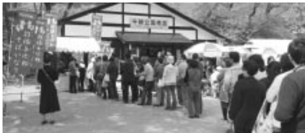
「招福 与次郎そばいなり」を求める長い行列

17日（金）の花見開始と同時に売り始めたところ、19日（日）までの3日間だけで3,000個以上が売れ、長い行列ができるほどの人気となった。