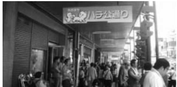
おおまちハチ公通り

なお、組合ではハチ公グッズや元気市による収益の一部を秋田犬の保存や継承に充てていくことについて検討中である。