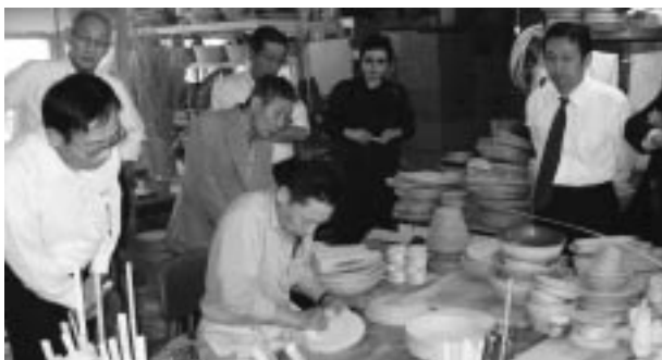
ブナコ漆器製造(株) 工場

また、「中央会との連携強化について」をテーマに意見交換等も行い、活発な議論が交わされました。