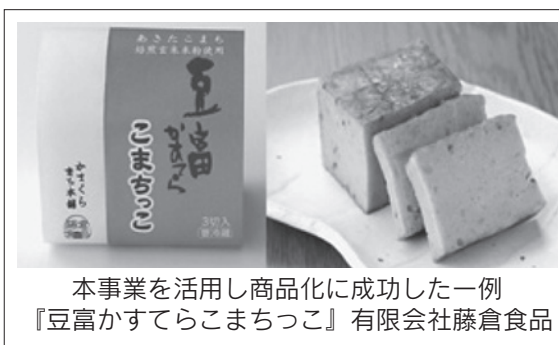
本事業を活用し商品化に成功した一例 『豆富かすてらこまちっこ』 有限会社藤倉食品