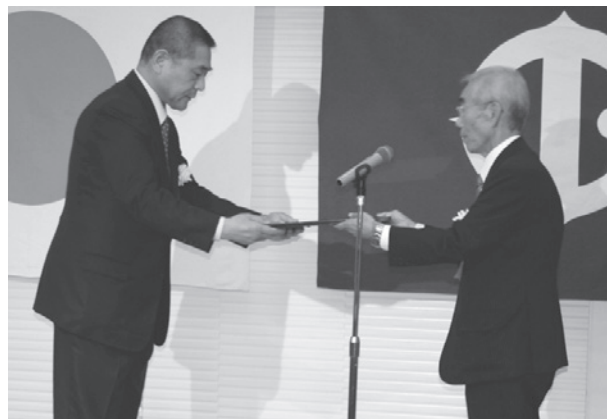
【塩田会長より表彰状を受け取る七尾理事長】