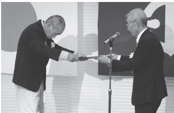
【塩田会長より表彰状を受け取る土門理事長】