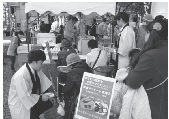
【試食アンケート実施の様子】

今後は、これまでに得られた各種調査結果を分析して、「首都圏で売れるための商品づくり」に取り組み、更に商品改良を加え、来年3月には、東京都内において開催する販売促進イベントで、現在の主力商品と併せて新商品として販売を開始することにしております。