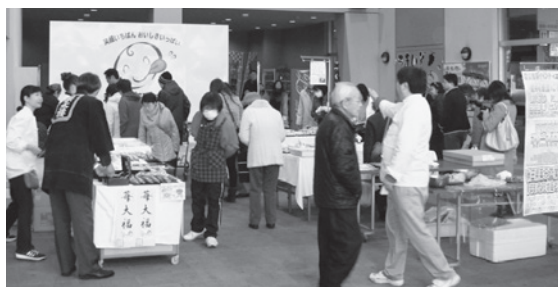
【震災復興イベントの様子】

イベントでは、秋田県菓子工業組合青年部がお菓子を販売し、500円以上購入すると、「仙台いちご」や「岩手県・宮城県・福島県の美味しいお菓子等」がプレゼントされることもあり、大勢の方々が来場しました。