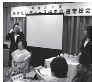
【交流サロンの様子】