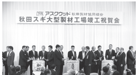
【竣工祝賀会の様子】