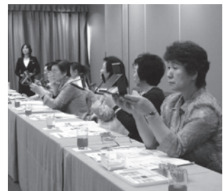
【メイクアップの実践】