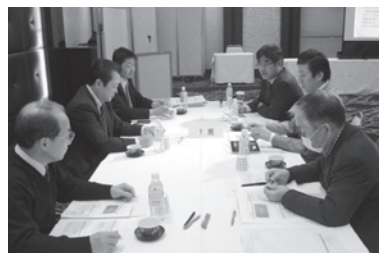
【グループ討論の様子】

今後も、当連合会では、新たな商店街活動を構築する際の足掛かりとなる研修を行っていく方針です。