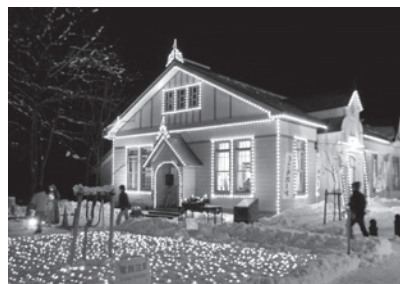
【電飾が施された天使館】

当組合では、今後とも、町の活性化のための事業を積極的に展開していくことにしております。