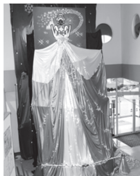
【写真撮影スポット】

この写真撮影スポットの利用は無料で、1月末まで設置されています。利用時間は午前10時～午後10時までですので、是非一度ご覧ください。