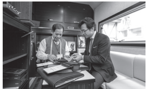
【車内で採寸・オーダー】