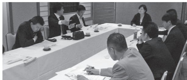
[第1回研修会の様子]

会員組合の皆様におかれましては、秋田県の施策・補助金や本会事業の内容について、必要に応じ本会職員がお伺いしご説明させていただきますので、どうぞお気軽にご相談下さい。