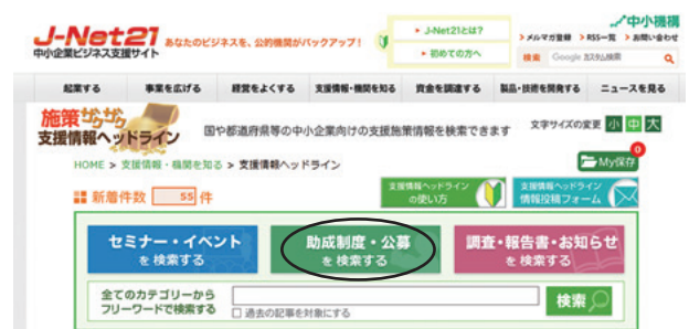
[J-Net21の支援情報ヘッドライン]