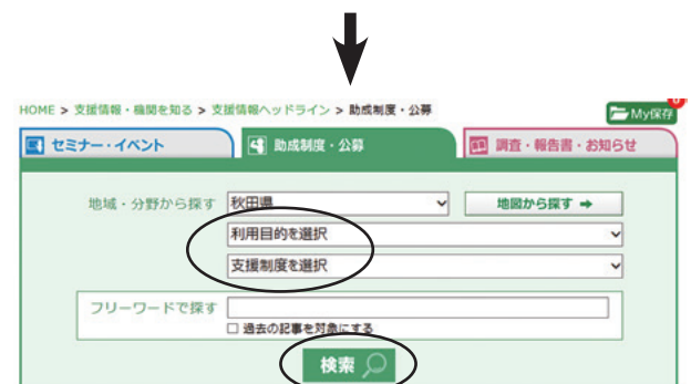
[閲覧したい情報を絞り込んで検索]