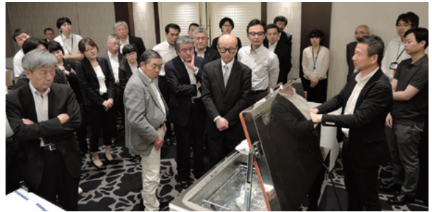
【デモンストレーションの様子】

あきた食品振興プラザへのお問い合わせにつきましては、事務局の事業振興部工業振興課 ☎018-863-8701までご連絡ください。