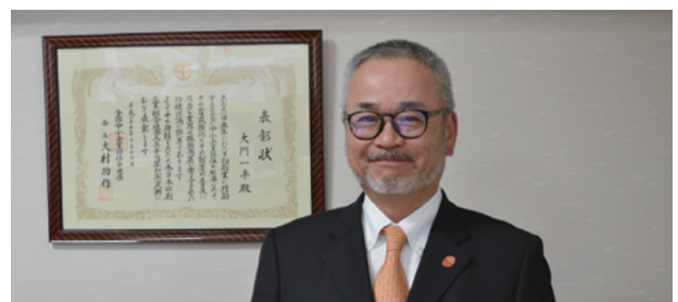
[秋田県印刷工業組合大門理事長]

このような環境の中で、都道府県単位の力でできることには限りがあり、全国印刷工業組合連合会との連携は非常に重要性を増していると考えます。「ハッピー インダストリー」をテーマに掲げた様々なプログラムを活用することで、時代の流れに乗り遅れることなく体質の強化を進めていただき、新しい時代に必要とされる会社経営を目指していただきたいと考えております。また、昨年実施した印刷営業講座は受講者の全員から「よかった」との評価をいただきました。人材の育成は業界の発展に欠かせないものと位置づけ、より役に立つセミナー等の実施に向け準備を進めてまいります。組合員より一層のご理解とご参加をお願い申し上げます。