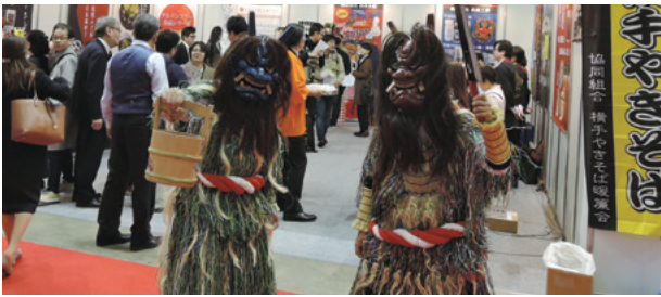
[ブースでのなまはげ]