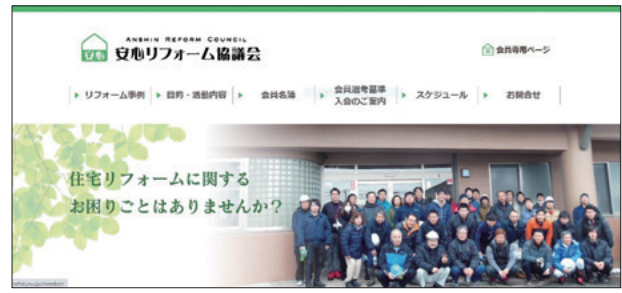
[安心リフォーム協議会のホームページ]

協同組合安心リフォーム協議会ホームページ http://www.refokyou.jp/