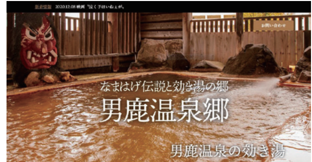
[男鹿温泉郷協同組合のホームページ]