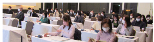
[セミナー受講の様子]

第二部では、本会職員より年度末事務手続きに関する一連の流れや留意事項について説明しました。