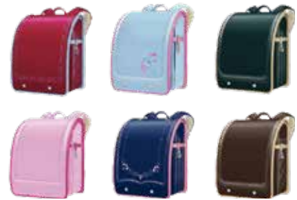
〈オーダーメイド ランドセル〉

オーダーメイドランドセルから既製品まで、「鞆専門店」 が自信を持ってお薦めできる「丈夫さ」「使いやすさ」「安全 性」をしっかりと考えられたランドセルを販売していま す。全体の色、サイズ、糸の色、内張の柄など、全て自 分で選んで自分好みに作れるフルオーダーのランドセル を超早割価格、早割価格の期間を設けていますので、早 ければ早いほど大変お得にご購入いただけます。安心の 6年保証、たっぷり収納、快適な背負い心地、安心安全 のための細部、使いやすさをあたりまえに。お子さんが 6年間使うランドセルです。気になること、分からない 事、ランドセルの事なら何でもお気軽にご相談ください。