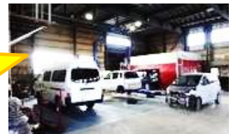
レンタカー リース 自動車損害保険